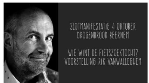
Waarom zelfs mijn schoonmoeder zot is... van koers

mariavanoverschelde@skynet.be . Uw inschrijving is pas definitief na overschrijving van het bedrag op rekening BE30 7387 0632 3811 van Neos Pittem-Egem.