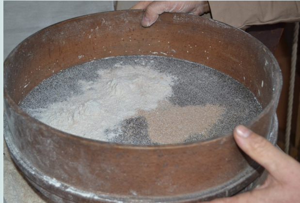
De zeef om de zemelen te scheiden van de bloem