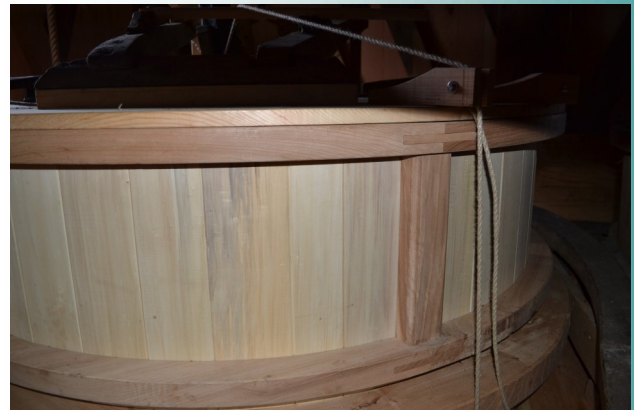
De nieuwe kuip