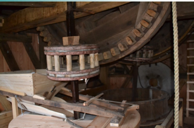
De ronsel moet ingeklikt worden