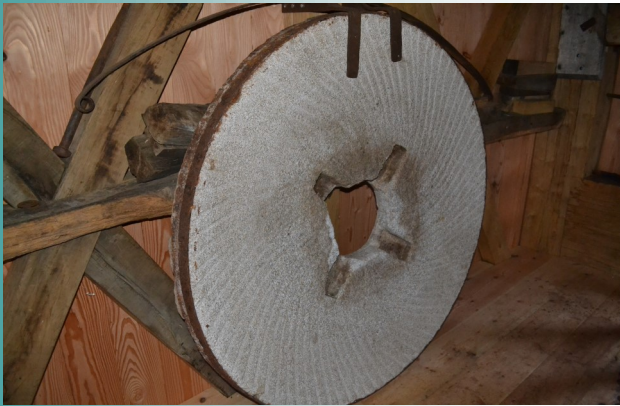
De kapot gevoren molensteen