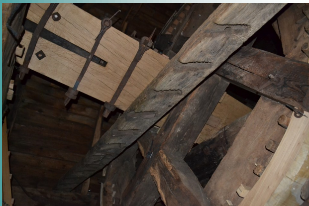
De wiekenas aan de voorzijde