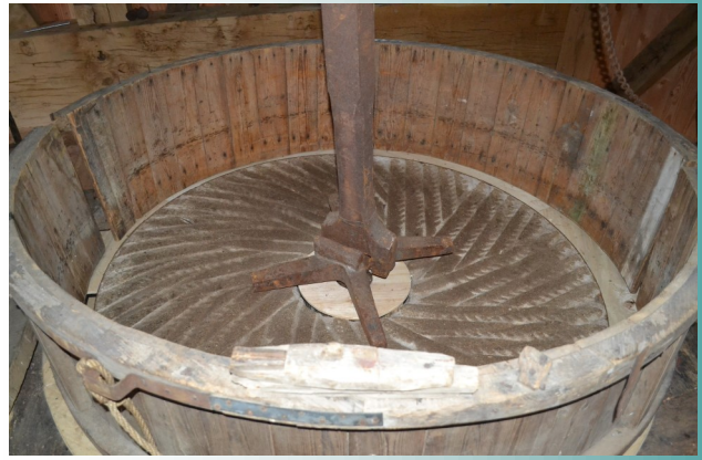
Hierin liggen de molenstenen