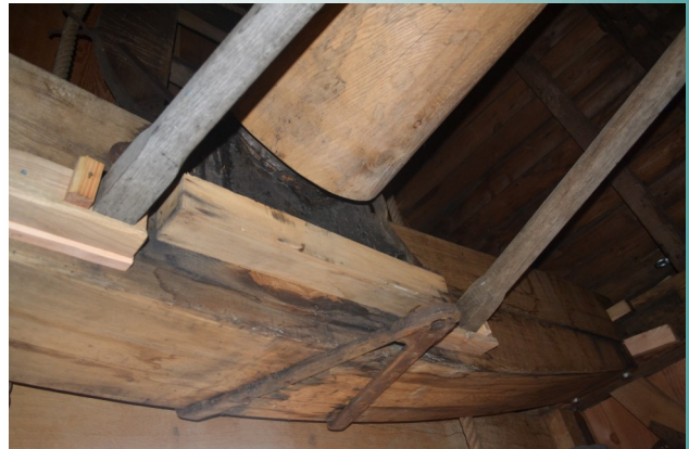
De blauwe steen aan de achterzijde