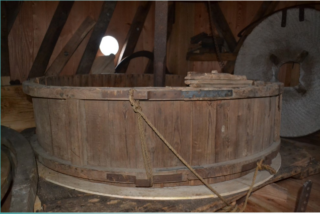
De oude kuip