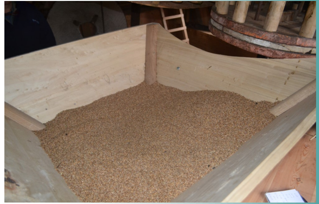
Tremel of invoerbak