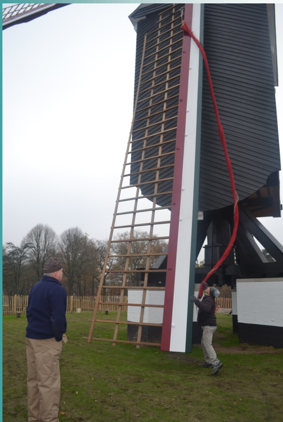
Het afzeilen van de wicken