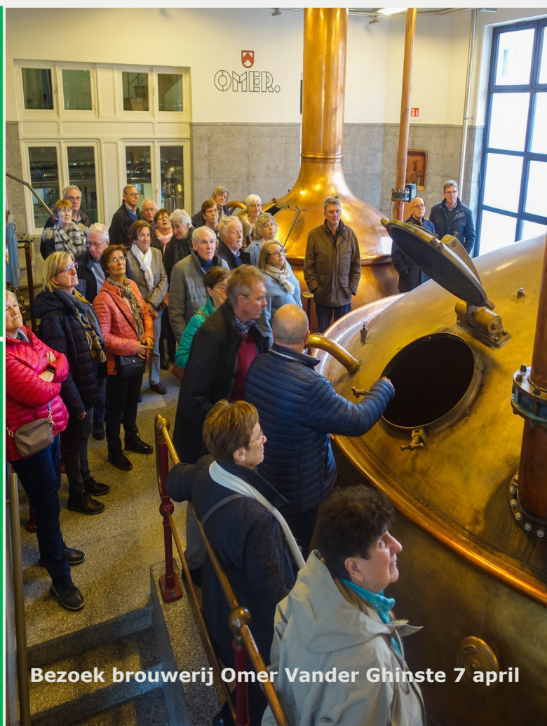
Bezoek brouwerij Omer Vander Ghinste 7 april