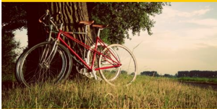
Fietszoektocht - 9de editie

Het zonnetje komt piepen, de zomerse dagen zijn in zicht.