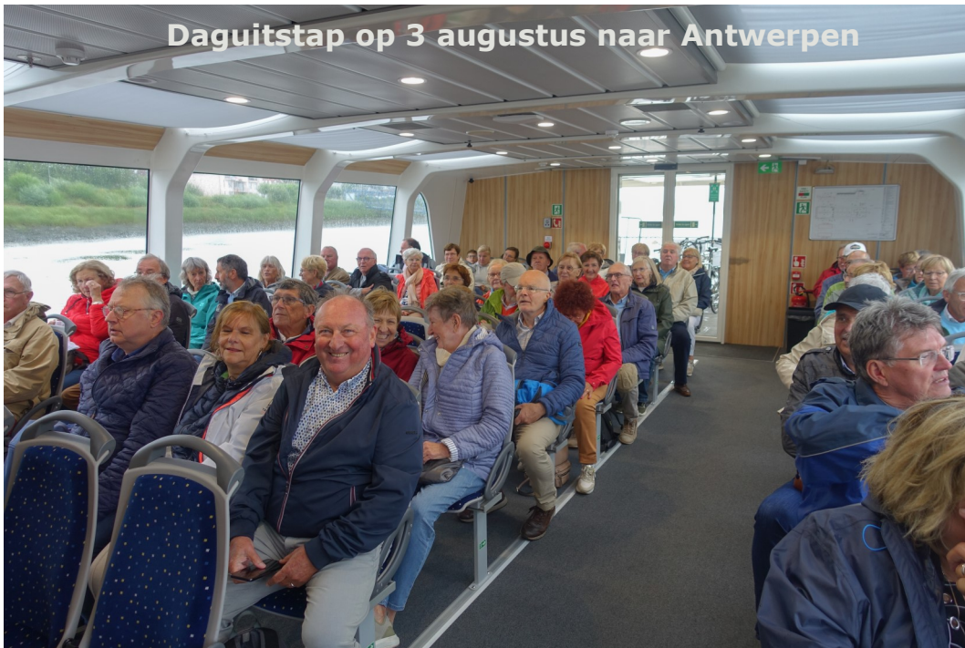
Daguitstap op 3 augustus naar Antwerpen

Je wordt bemind als je geboren wordt Je zal bemind worden als je sterft Daartussen moet je het doen.