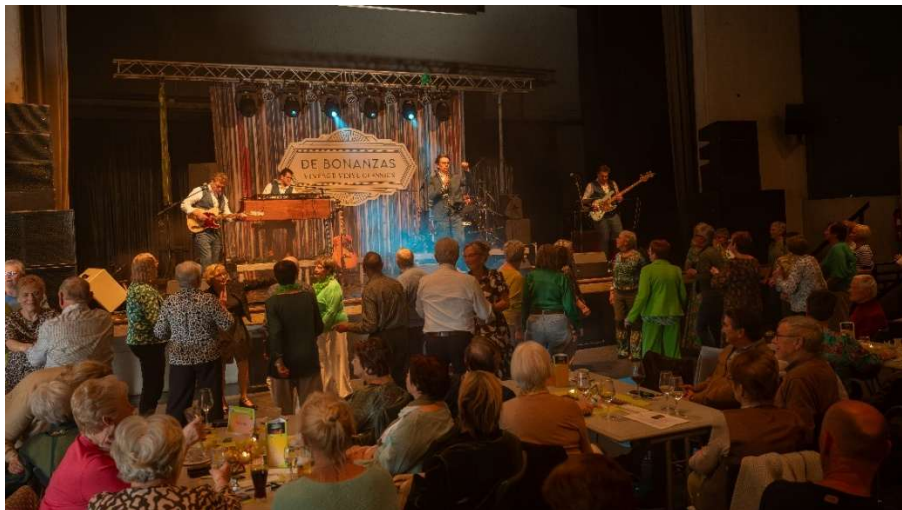
Golden Evergreens: muziek van toen, die nog altijd blijft leven.

Allemaal liedjes die ooit de dansvloer deden vollopen en vandaag nog steeds raken. In de sfeer van de jaren zestig en zeventig nodigden De Bonanzas uit om te luisteren, mee te zingen en een dansje te wagen... De sfeer zat er goed in!