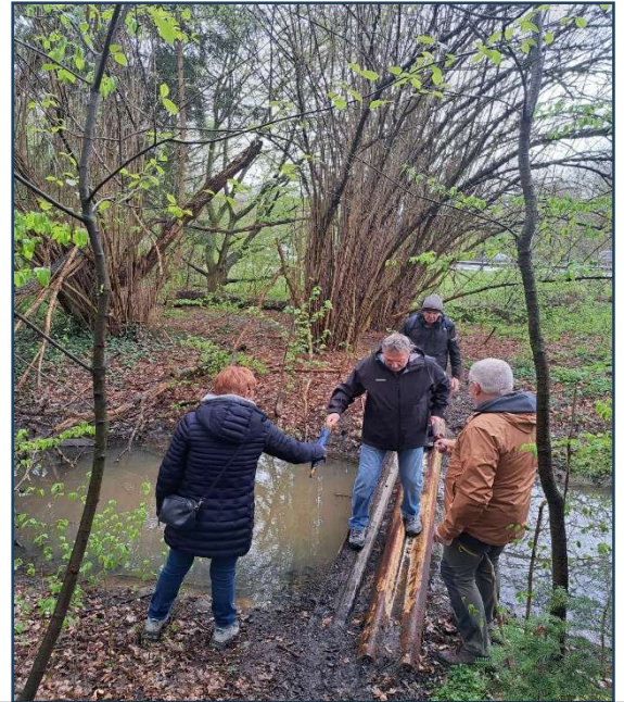
De wandeling op 2 april in het natuurgebied Zenneboorden in de buurt van Technopolis was voor de eerste keer een waar avontuur!

Ook onze dauwwandeling was op twee fronten een groot succes. Maar liefst 60 inschrijvingen voor het ontbijt, waarvan 29 leden om 7 uur klaarstonden voor de mooie wandeling in de Dorent te Eppegem. En we knoopten terug aan met de vroegere traditie en het kernteam maakte zelf ontbijt met spek en eieren. Blijkbaar lekker en meer dan voldoende. Ook weer voor herhaling vatbaar.