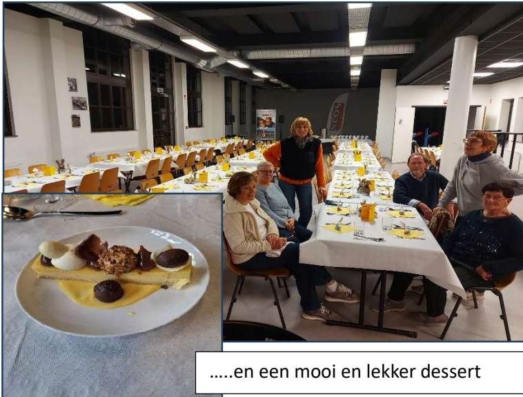
.....en een mooi en lekker dessert