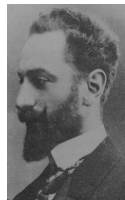
Henri d'Udekem d'Acoz