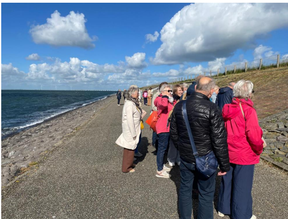
9 juni: Zeeland, aan de Oosterschelde