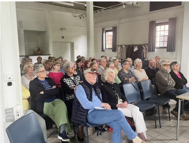
Lezing Koning Albert II

We werden onthaald op het Loeyakkershof in Brecht. De huifkar bracht ons naar een modern melkveebedrijf, waar we uitleg kregen over de werking. 's Middags genoten we van een boerenmaaltijd. Daarna maakten we met de huifkar een rondrit door de Brechtse Heide, waarbij we konden luisteren naar korte verhaaltjes over de streek. Een drankstop in het café van de Trappisten was een goede afsluiter van deze geslaagde dag.