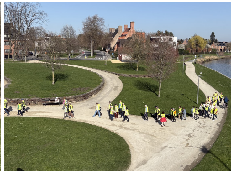
Op weg naar de Deelfabriek in Kortrijk op 5 maart

PETANQUE: dinsdagen 7 en 21 april om 14u op de terreinen van Leiemeers . Verantwoordelijke: Jaak Callens. GSM: 0473 64 63 09 E-mail: callensjaak@gmail.com